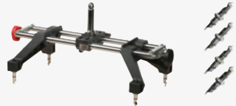
● Staffa 10-19" vettura e 17,5-25 camion 10-19" car bracket and 17,5-25" truck bracket

Barra multilink per: VW - Audi - Skoda - Multilink bar for: VW - Audi - Skoda