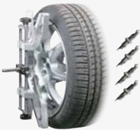
● Staffa autocentrante 10-26" professionale 10-26" professional bracket