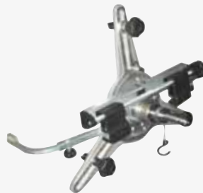
● Staffa rapida 9÷21" 9-21" quick wheel clamp